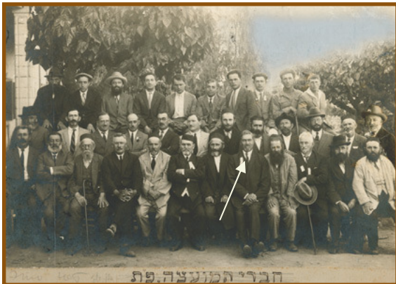
חברי החקלאות פתח